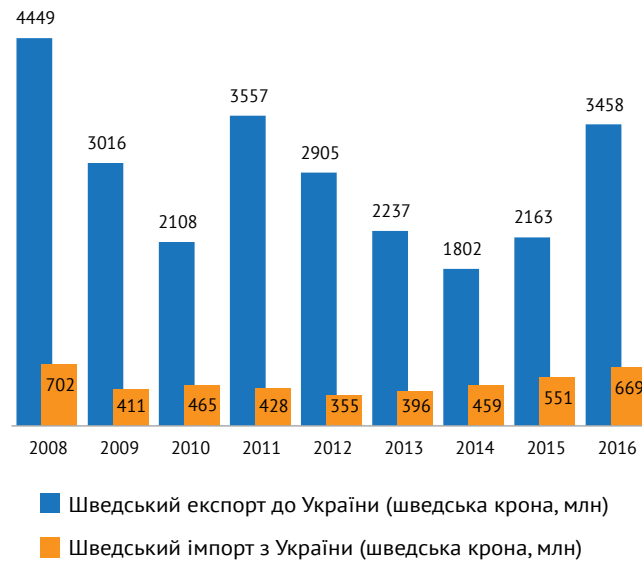
Графік 3. Двостороння торгівля